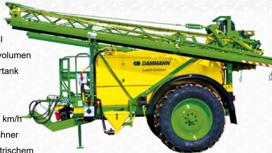
Grundausrüstung mit optionalem Kotflügel und Schmutzfänger