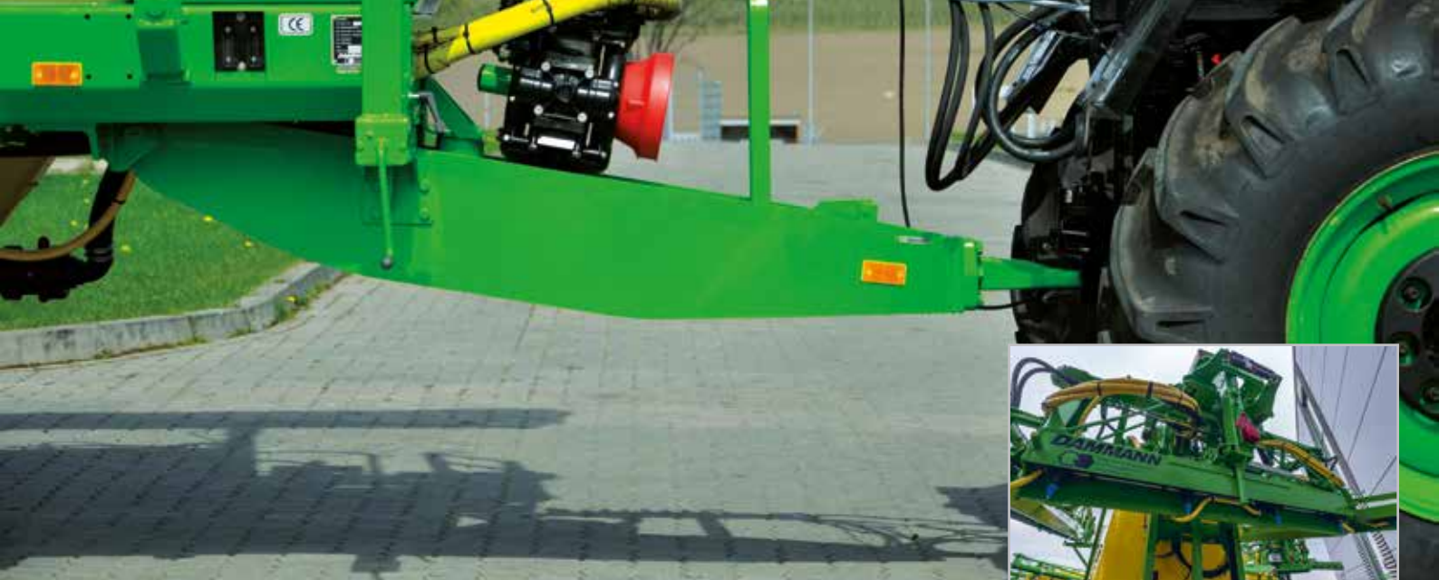
Beispiel: Untenanhängung als Sonderausstattung