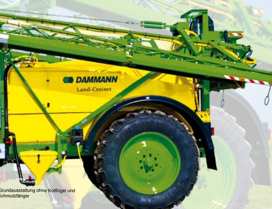
Brundausrüstung ohne Kotflügel und Schmutzfänger

Баки Dammann с Gelcoat покрытием имеют прямоугольную форму, 10%-й запас объема под образование пены, низко расположенный слив, а так же легко очищаются встроенными дюзами. Три поперечно расположенные перегородки обеспечивают дополнительную безопасность при движении по дорогам общего пользования с полупустым баком. Идеальное распределение веса на ось достигнуто вследствие размещения бака чистой воды в центре основного бака, объема которого достаточно для тщательной очистки основного резервуара.