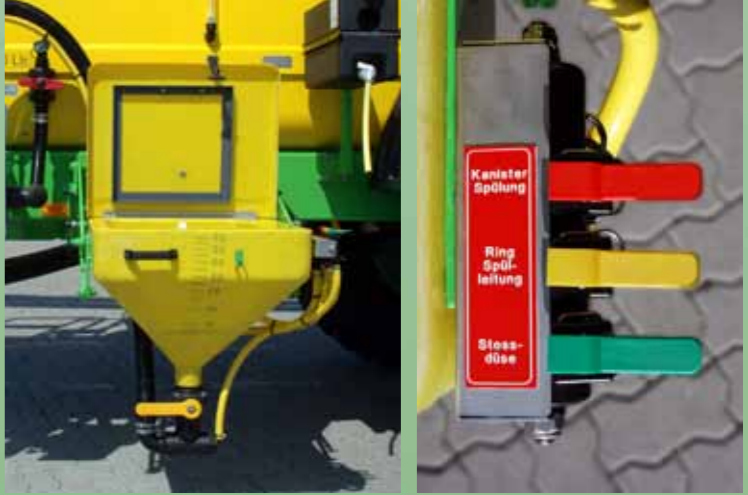
Fustreiniger (inh. 60l, zuigvermogen 400 l/min) met ringspoelleiding, roterende spoelkop en mengdop.