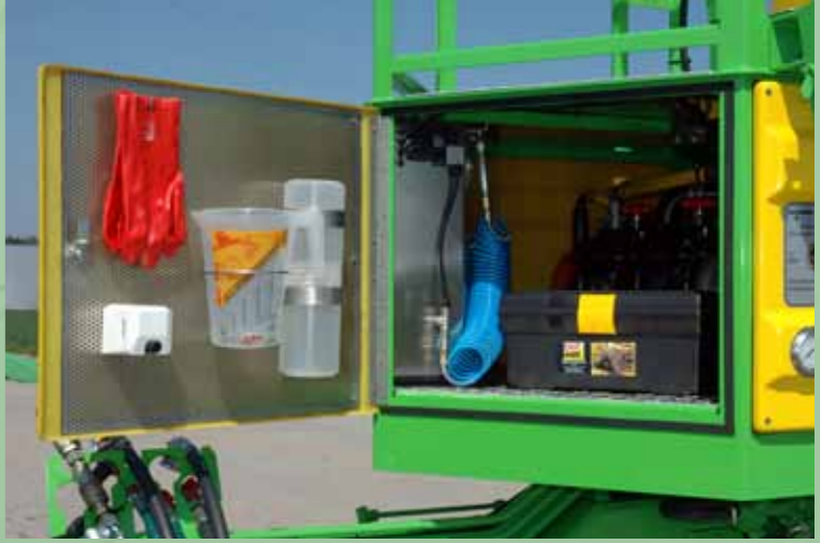
Afsluitbare opbergruimte voor gereedschap en toebehoren.