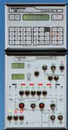
SRAY-Control S & Bedienteil II

Verschillende bediening en computer mogelijkheden, aangepast aan uw bedrijf.