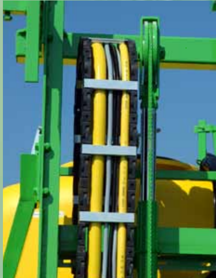
Centrale slangendoorvoer dmv een kabelrups in de hefmast.