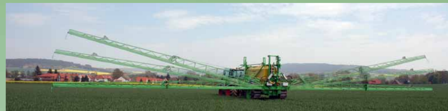
Spuitboom correctie voor optimale hoogteaanspassing in heuvelgebied.