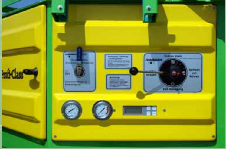
Overzichtelijk en makkelijk te bedienen met behulp van kranen