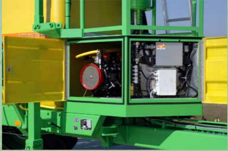
Alle belangrijke onderdelen, zoals elektrische sturing, kleppen en de pomp, zijn goed beschermd.