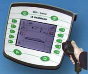
BASIC-Terminal & BASIC - Terminal TOP