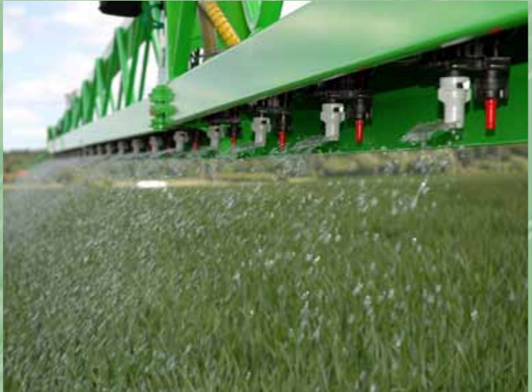
De nieuwe spuitboomconstructie zorgt voor een langere levensduur en onderscheid zich door een optimale bescherming van de meervoudige doppenhouders en zorgt voor een betere stabiliteit. Ook geschikt voor vloeibare bemesting met kunstmestdoppen.