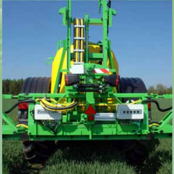
De spuitboomophanging zorgt voor de hoogst mogelijke stabiliteit, optimale bediening en is de basis voor een goede en precieze werking.