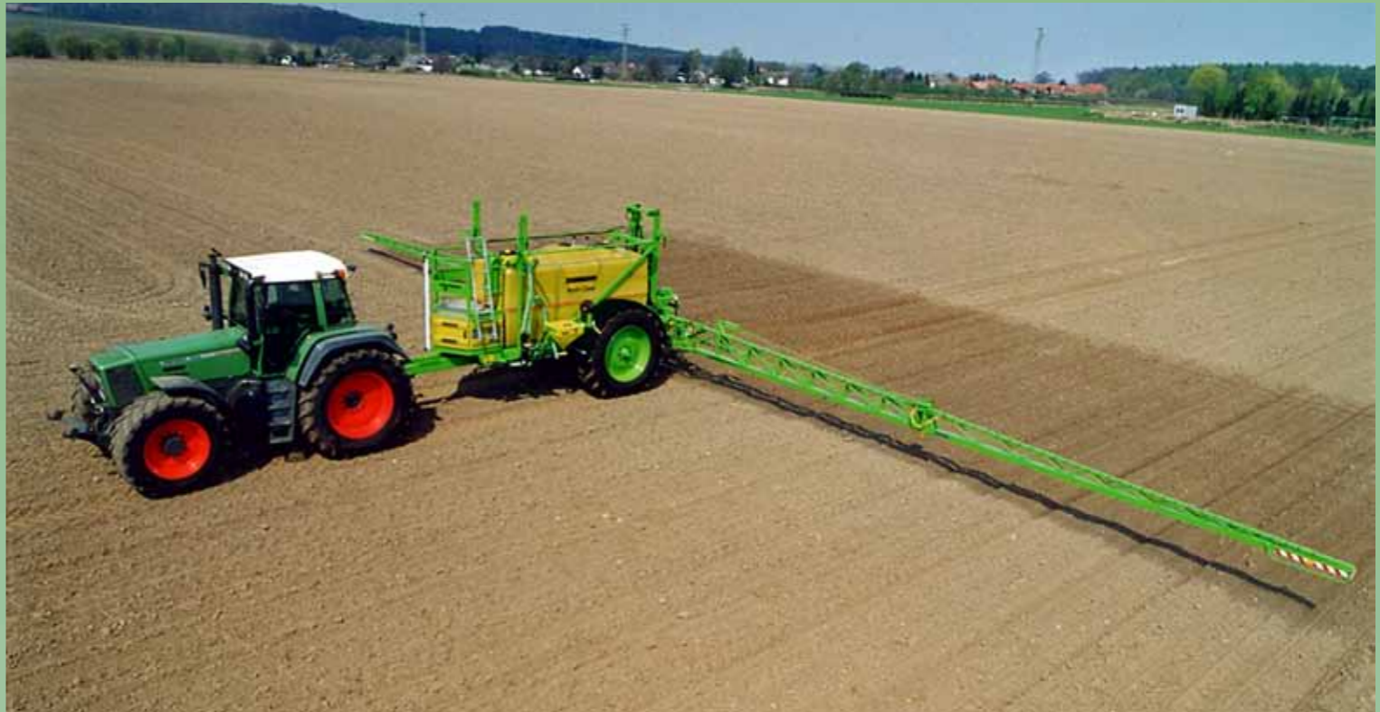
Pneumatische drukregeling en een geïntegreerd rondpompsysteem zorgt voor een snelle drukregeling, directe schakeling van spuitdoppen en een milieuvriendelijke toepassing.